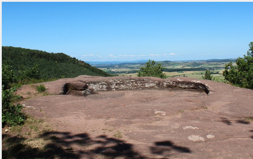
(OT Pays de Saverne)