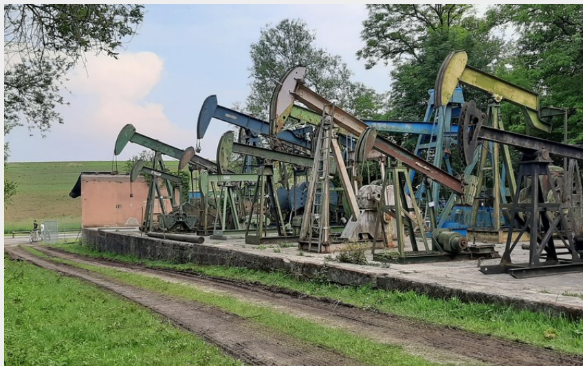
Les pompes à balancier (PNRVN - I_Vergnaud_Goepf)