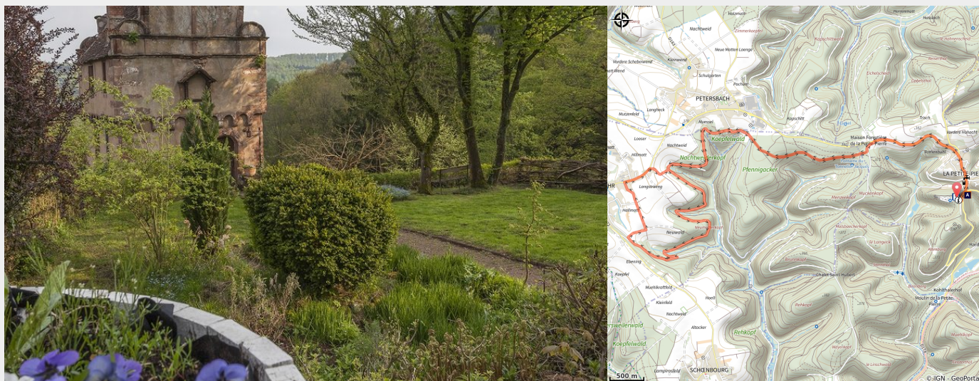
La Maison des Païens (R. Letscher)