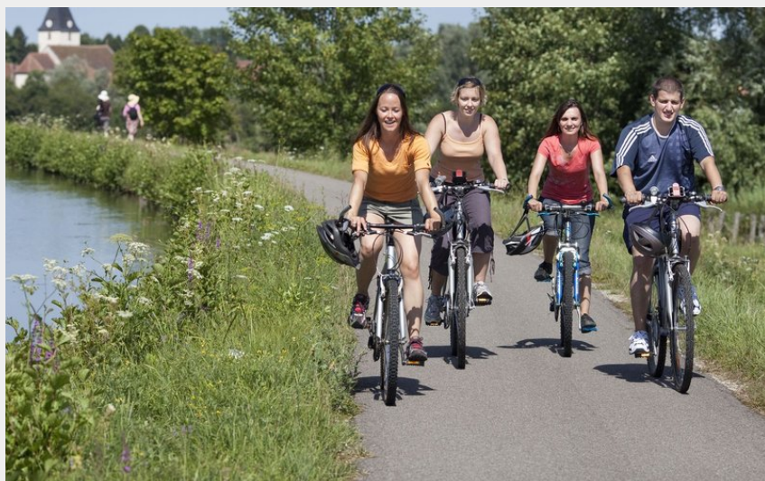
Piste cyclable le long du canal