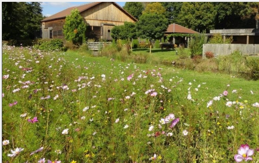
Site du moulin d'Eschviller