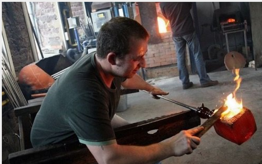
Savoir-faire des verriers de Meisenthal