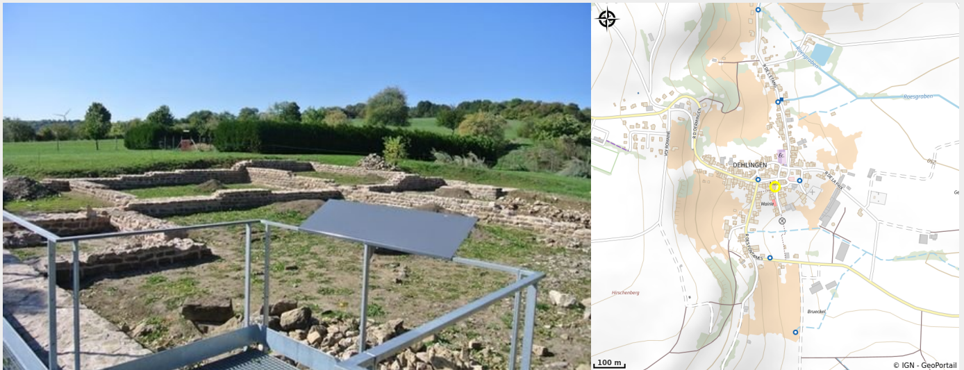
Crédit photo : La villa gallo-romaine du Gulterbach ( https://www.tourisme-alsace.com )

Venez découvrir l'archéologie et le travail des archéologues !