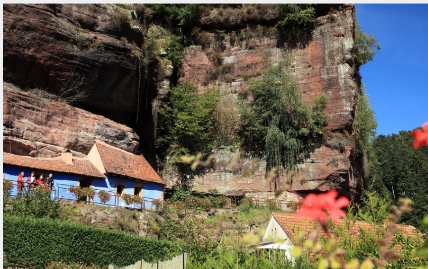
Maisons des rochers de Graufthal (T.Bichler)