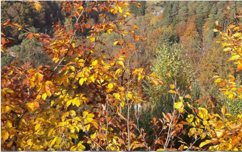
Autour de Sturzelbronn