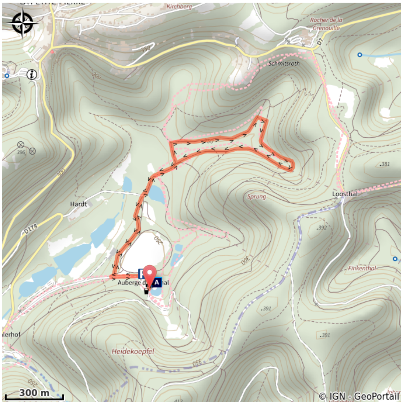
Étang d'Imsthal (A)