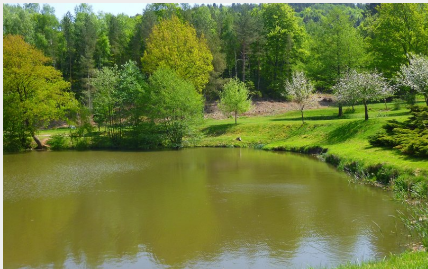
Étang d'Imsthal