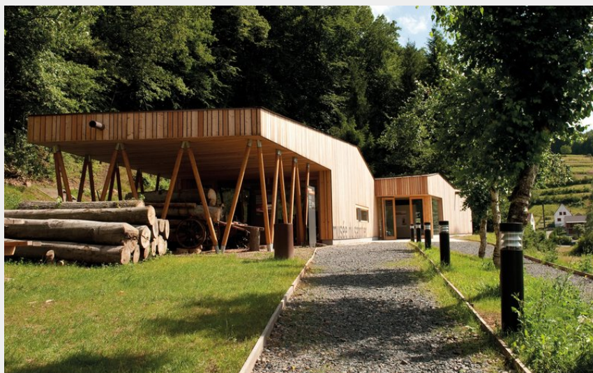
Musée du sabot (PNRVN)