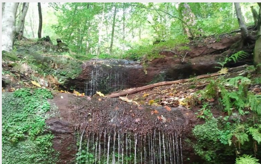
Cascade des Ondines à Lemberg